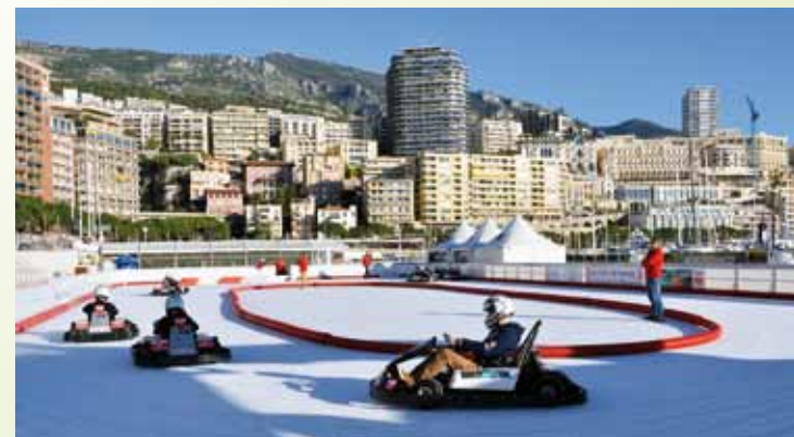
Tous les modes de transport électrique ont été représentés : scooters, vélos à assistance électrique, automobiles et karts.

Organisé par le Club des Véhicules Électriques de Monaco, en étroite collaboration avec la Direction de l'Environnement (D.E) et la Direction de l'Éducation Nationale de la Jeunesse et des Sports, ce rendez-vous annuel a pour but de sensibiliser les collégiens des classes de 4 e à la problématique de la pollution liée au transport routier urbain et aux solutions pour la réduire.