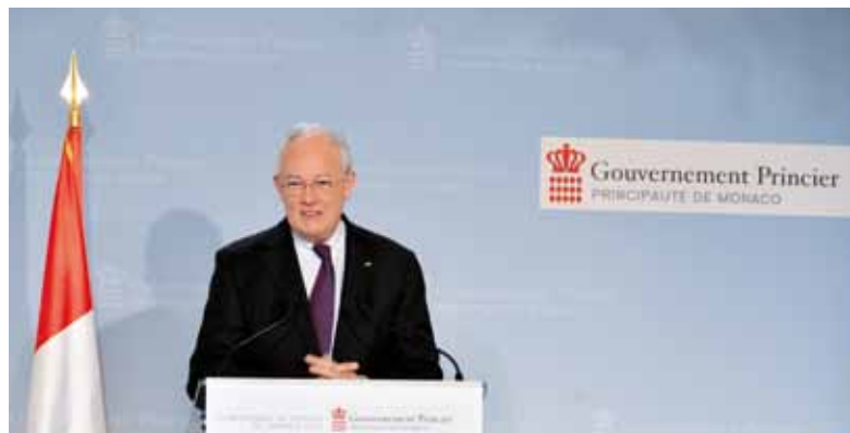
S.E.M. Michel Roger présente le nouveau logo à la presse