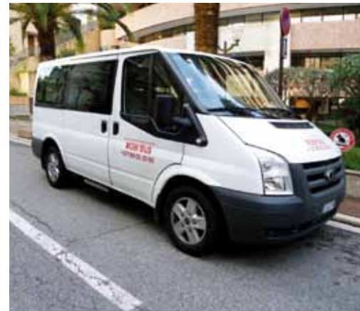
Rappelons que le 1 er Mobi'bus fonctionne depuis l'année 2008 et qu'un 2 e Mobi'bus a été mis en service en novembre 2012.

En effet, ce service de transport adapté, doté de deux véhicules, est destiné aux personnes handicapées ou âgées, à mobilité réduite, résidant en Principauté. Avec 15 % d'usagers en plus sur l'année 2013, le service Mobi'Bus devait répondre à une forte demande concernant les périodes ouvrables.