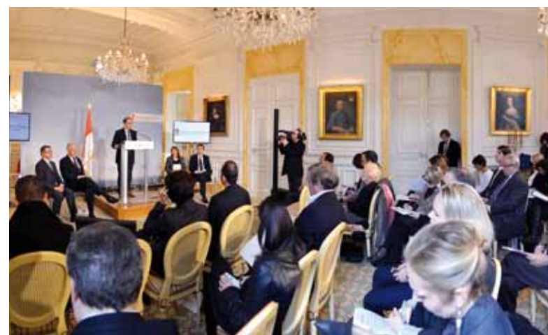
La conférence de presse s'est tenue le 30 janvier au Ministère d'Etat

Ce nouveau logo va également donner un ton à la communication institutionnelle en Principauté. Pour exemple, la Direction des Services Judiciaires a souhaité se doter d'une identité spécifique en adoptant un logo qui conserve les codes graphiques de celui du Gouvernement Princier mais qui possède un caractère propre.