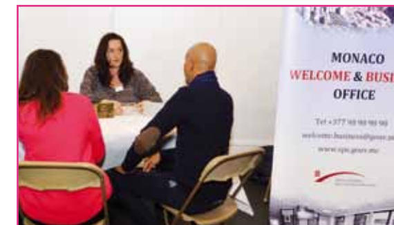
Le stand du MWBO / Plan Accueil lors de la 20 e journée des métiers qui s'est tenue au Collège Charles III le 9 février.

Ces jeunes interlocuteurs étant parfois eux-mêmes des « primo-arrivants », il a été « très enrichissant d'échanger avec eux sur les conditions de leur arrivée en Principauté ».