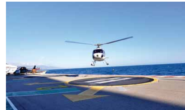
Les Contrôleurs du trafic aérien, la coordination des vols avec les services d'assistance aéroportuaire mais aussi des vols étrangers avec les services de police et douaniers. Les Contrôleurs rendent compte également des mouvements journaliers, relèvent les infractions et sont assermentés pour rédiger des procès verbaux.

Autre mission, la gestion des « fiches réflexe » en coordination avec les pompiers et la police maritime qui permettent de signaler d'éventuels départ d'incendie sur des bateaux en détresse par exemple.