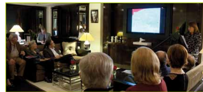
Pour une approche plus concrète encore, deux vidéos ont été projetées : la première sur le Nouveau Centre Hospitalier Princesse Grace, la seconde sur la rénovation de la Roseraie Princesse Grace, réalisée pour son 30 e anniversaire.