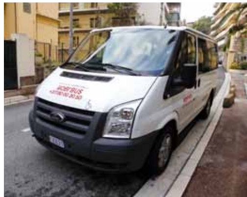
Le Gouvernement Princier tient à souligner qu'il s'est efforcé d'ajuster régulièrement l'offre de transport en fonction des besoins recensés au sein de la population résidente.