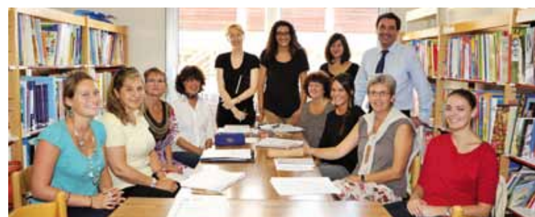
L'Équipe du Centre de Formation Pédagogique

Outre l'aspect pédagogique de ses missions, le CFP est également chargé de l'éducation spécialisée pour les élèves bénéficiant de dispositifs d'aide personnalisée en primaire et dans le secondaire (voir ci-après).